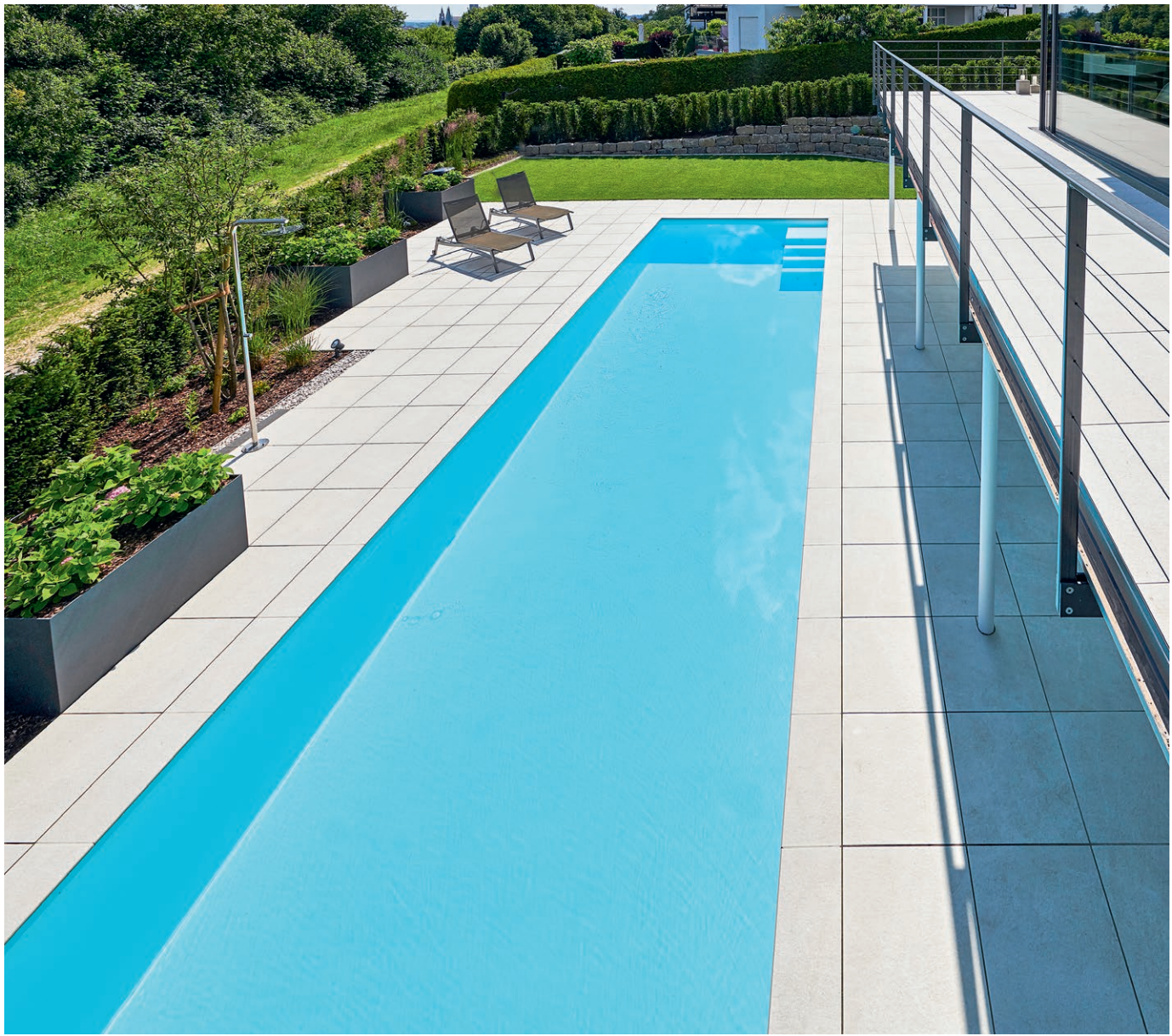
Das Foto oben zeigt den Swimmingpool in seiner ganzen, beeindruckenden Länge. Hier kann man ganz ungestört seine Bahnen ziehen. Das Foto unten zeigt die beiden fast nicht sichtbaren Oberflächenabsauger: „Skimmer Invisible“.