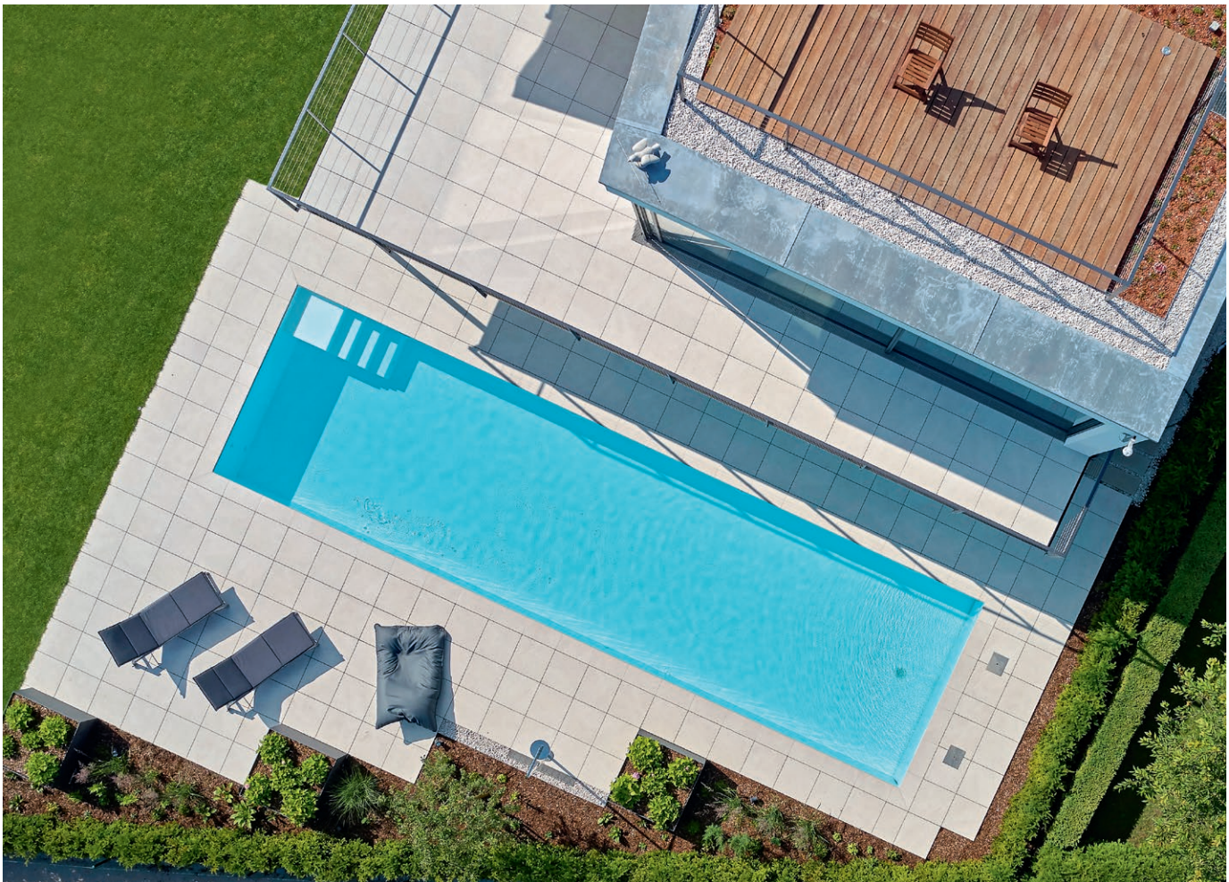
Bild aus der Vogelperspektive (oben): Die Maße des Swimmingpools sind harmonisch auf die Maße der Terrasse abgestimmt. Auf dem Bild unten sieht man die Rollladenabdeckung, die vor Verunreinigungen des Wassers schützt.